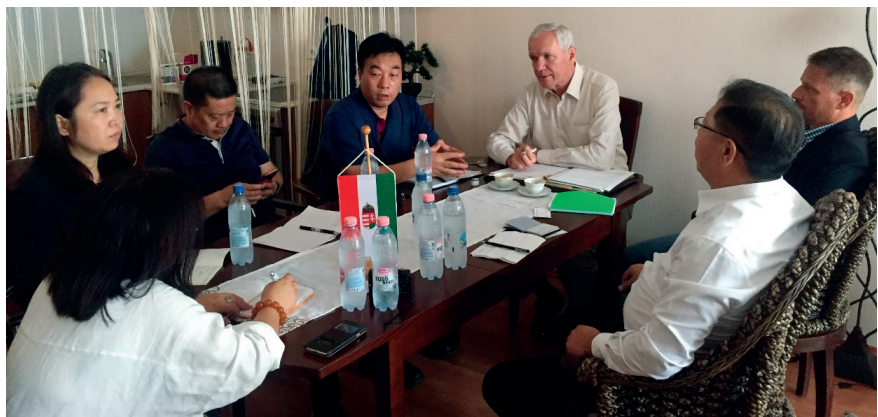
A megbeszélésnek Laosz Magyarországi Konzulátusa volt a helyszíne Budapesten

Magyar részről röviden tájékoztattuk a kínai felet a MA-HAL szervezetéről és mű- ködéséről, illetve a kínai kapcsolatokról, a magyar kínai együttműködésről a halá- szat, illetve az akvakultúra területén. A kínai szakemberek elmondták, hogy a hal-