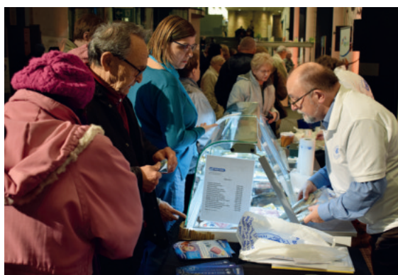
A tavaly decemberben megrendezett Várkert Halbazar is nagy közönségsikert aratott

– A fenntartható mezőgazdaság az egyik kulcsszavunk. Oda kell figyelni arra, hogy a mezőgazdaság minél kisebb károsanyag-kibocsátással állítsa elő az