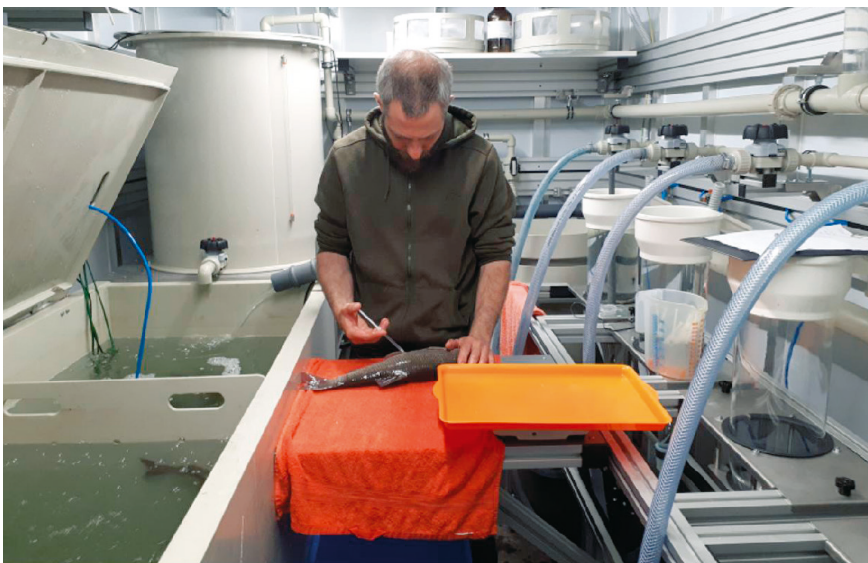
A mozgó keltető kis helyen, akár egy 4x2 méteres utánfutón is elfér

szükség a diverzitás megőrzéséhez, hanem fajspecifikus szabályokat kellene hozni. Tudományosan igazolták, hogy a C&R-horgászat hatására a halak „megtanulják” elkerülni a horgot, ezáltal a horgászat hatékonysága romlik. Hogyan lehet kezelni a helyzetet, illetve kell-e ke-