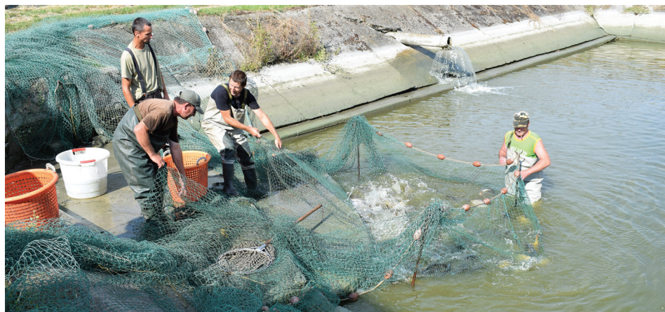
A szubextenzív termelés nem rontott a ponty minőségén

pedig 30 hektárnyi tóba egyáltalán nem jutott víz. Mindkét káresemény tanulságait levonva tavaly még okszerűbben gazdálkodtak, ami ez esetben azt jelenti, hogy rendszeresen mérik a vízminőséget, a meglévő vizet pedig nagy becsben tartják. Mindez persze a termelési eredményeken is meglátszik, hiszen a megszokottnak alig több, mint a fele lett a lehalászott „halter-més”.