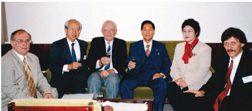
Az NSZSZ 1996-ban Budapesten rendezte meg az éves halászati szemináriumát. Felvételünk a Budapest Hotelben készült

gödöllői Agrártudományi Egyetemet kimentéses oklevéllel végezte, míg a doktori iskolát Summa cum laude minősítéssel zárta. Az agráregyetemet agrármérnöki diplomával 1964-ben fejezte be, ám a '70-es években további két szakdiplomával is bővítette a tudását: 1972-ben sikeresen vizsgázott a halgazdálkodási, 1975-ben a vadgazdálkodási szakokon is. A doktori címet 1982-ben kapta meg, a disszertációját a „Növényevő halak tartósítása gyorsfagyasztással” címmel védte meg.