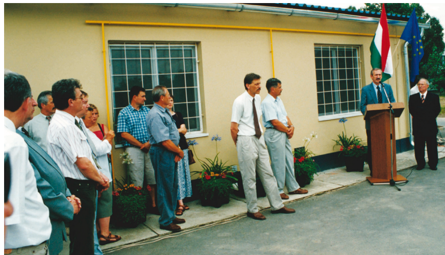
A gyomaendrődi halfeldolgozót Németh Imre földművelésügyi miniszter adta át 2004-ben

hatta, amit szeretett. Hitvallása, hogy úgy kell végezni a munkánkat, hogy azzal másokat is segítsünk. Minden körülmények között becsüljük meg a másik embert! Az utókornak pedig azt üzeni, hogy legyen bátorságuk, kitartásuk, erejük az álmaik megvalósításához. És éljék át azokat az élményeket, amelyeket Tóni bátyám is megélt a Tisza folyón és a Tisza mellett.