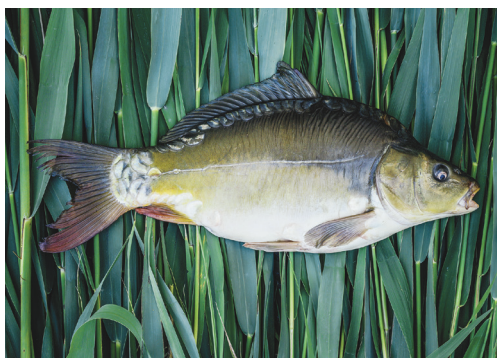
Az eredetvédelemmel védett Szegedi Tükörponty

A cégvezetés minden évben értékeli a gazdasági helyzetet, de tavaly decemberben a lehalásztás és az aktuális munkák miatt még nem tudtak mélyreható elemzést végezni. Ezért az ügyvezetővel beszélgetve csak a mennyiségi csökkenéshez vezetők okokat vettük sorra.