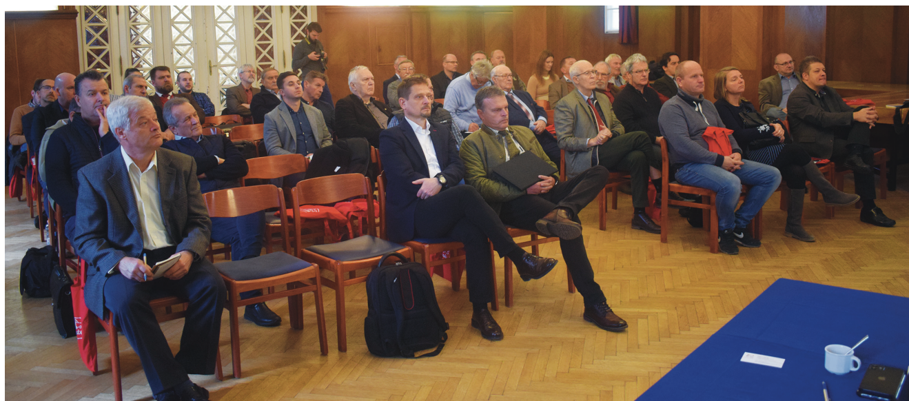
A közgyűlés résztvevői

A halászat sok olyan kihívással néz szembe, ami próbára teszi az alkalmazkodóképességét. A csúcstechnológia alkalmazása is szükségessé vált, mert alkalmazko-