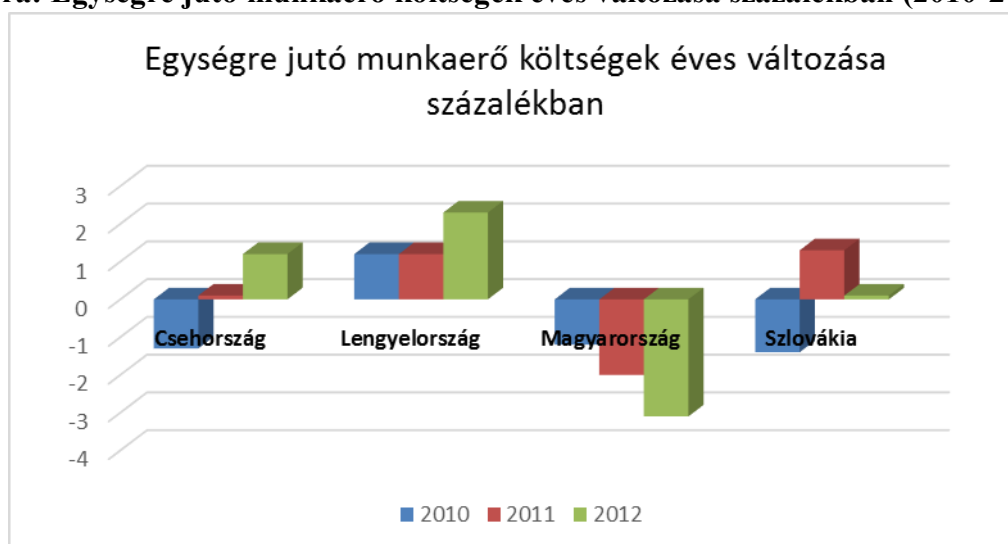
1. ábra: Egységre jutó munkaerő költségek éves változása százalékban (2010-2012)

Forrás: Organisation for Economic Co-operation and Development Factbook 2010-2014 Economic, Environmental and Social Statistics