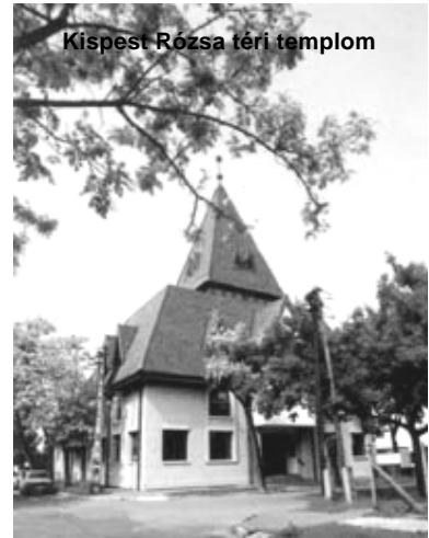
Kiszpest Rózsa téri templom