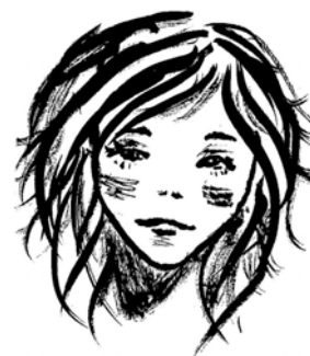
Csáky Zsuzsa rajza

- Ha kétségbe esel (vagy kimerültél), tedd fel magadnak a következő kérdést: „Szeretem eléggé a gyermekemet ahhoz, hogy megőrizzem az irányítást?”