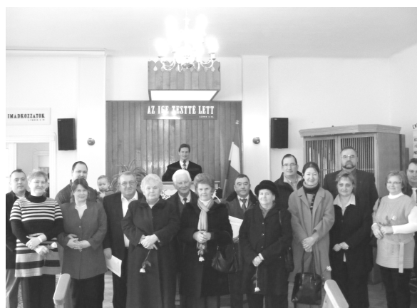
Jubiláló házaspárok 2012.

A díjak tartalmazzák a szállás, teljes ellátás költségeit és az idegenforgalmi adót.