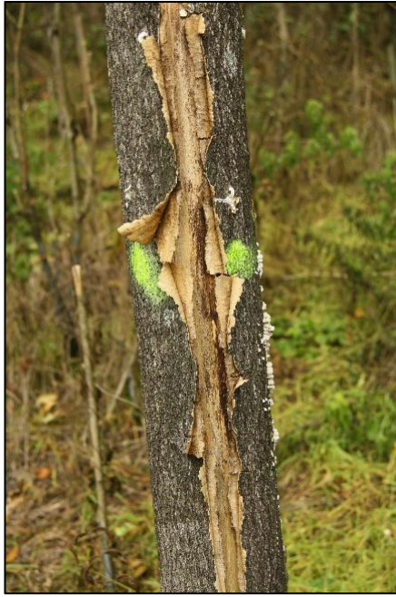
1. fotó: Injektált törzs