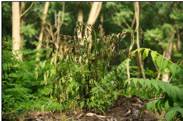
2. fotó: A permetezéssel kezelt bálványfa sarjakon a vegyszer hatása a kezelést követően