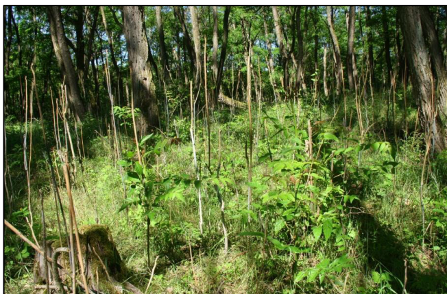
3. fotó: A kenéssel kezelt sarjak nagy százalékban véglegesen elhalnak

A sarjkenést 5 cm törzsméretű alatti 1 méternél nagyobb egyedeken végeztük, a kéregre hosszú szárú ecsettel történő kenéssel. A felhasznált vegyszer itt Medallon Prémium, Mezzo valamint Invázív adjuváns tankkeveréke volt.