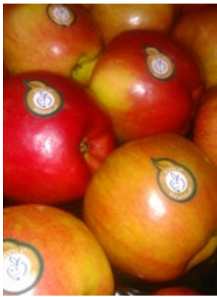
A zamatos piros fedőszínű Rozela