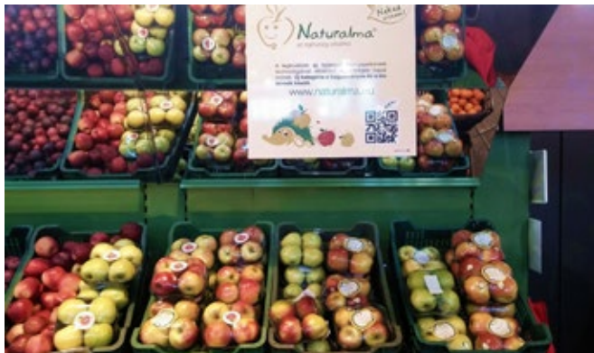
Az Interspar áruházakban Naturalma információs tábla tájékoztatja a vásárlókat

2016: A Naturalma fajta választékunk egy hiánypótló, finom, júliusban érő piros nyári almával egészül ki, az ALLEGRO-val. Elkezdtük a fajta szaporítását. 2017 őszén várhatóak az első telepítések. 2020-ban remélhetőleg már a kedves fogyasztók is élvezhetik az Allegro friss, üde ízét. Almafajtáink megismertetését hazai (Agromash expo) és nemzetközi vásárokon (Interpoma), kóstoltatókon, bemutatókon folytattuk. A fogyasztók és a kereskedők kóstolókon, és a vásárlások utáni visszajelzése, nekünk és termelő gazdáinknak is nagy öröme szolgált. Az Interspar áruházakban és a Budapesti Nagyban piacon a fajta és a Naturalma márkaismerést növelő, ismeretterjesztő kampányt folytattunk és ünnepi promóciókban vettünk részt.