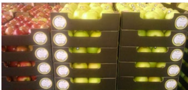
A Naturalma útra készen a kereskedőkhöz

A 2017-től következő évek: Naturalma BIO, Naturalma késztermékek, új innovatív fajták. A Naturalma fajtáink teljes mértékig alkalmasak a biotermesztésre. Két biobemutató kert hoztunk létre Naturalma fajtákra alapozva. Itt kívánjuk bemutatni a telepítést tervező biogazdáknak, fajtáink alkalmazkodását a biotermesztési körülményekhez. Teljes biotermesztési technológiát dolgozunk ki, tájékoztatást, bemutatókat tartunk termőhelyekre adaptálva.