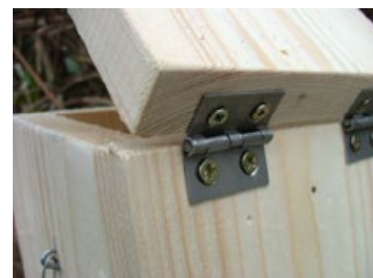
4. ábra. Madárodú fedele

Az odúknak tartós, felületkezelt faanyagból kell készülniük. Az odúk fedele felnyitható legyen, hogy az ellenőrzést, tisztítást el lehessen végezni, ugyanakkor stabilan rögzíthető is, hogy a ragadozók és az időjárás ne tessenek kárt a fészekaljban (4. ábra).