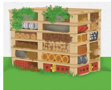
2. ábra. Búvóhely raklap felhasználásával

A búvóhelyeket úgy alakítsuk ki, hogy azok összmérete elérje az 1 m 2 -t hektáronként . Fontos tudni, hogy minden megkezdett hektár után biztosítani kell az 1 ha-ra előírt 1 m 2 nagyságot! A búvóhelyeket készíthetjük raklapok segítségével is (2. ábra).