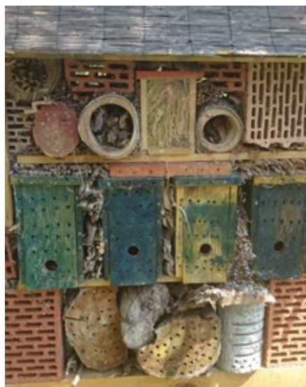
1. ábra. Különböző elemekből összeállított búvóhely

A pályázati felhívásban közzétett útmutató szerint nem szükséges lefedni az építményt, de célszerű, mert gondoskodni kell az építmény állékonyságáról, mivel azt megfelelő állapotban kell tartani legalább 2020. december 31-ig.