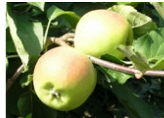
7. ábra. A Húsvéti rozmaring

Húsvéti rozmaring (syn.: Rozmaring alma): Talán magyar eredetű fajta, 1535 óta ismert. Inkább házi kerti, mint üzemi fajta (7. ábra). Termése nagy, s ezzel értéket képvisel a nyári fajták között. Kiváló rétes- és főzőalma. Hatalmas lombkoronát fejleszt, későn fordul termőre. Intenzív koronaformát nem lehet kialakítani belőle. Rossz tulajdonsága, hogy termőképessége szakaszos és nagyon érzékeny a varasodás betegségre.