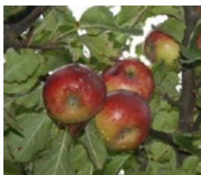
9. ábra. Téli piros pogácsa

Téli piros pogácsa (syn.: Piros pogácsa alma): Mi ősi magyar fajtának tekintjük. Kisüzemi és házi kerti termesztésben volt keresett. Nagy értéke, hogy az Alföld homokjain is jól tenyészik. Erős növekedésű, igénytelen fajta (9. ábra). Szép színű, jól tárolható fajta. Termesztésben tartása igénytelensége miatt indokolt. Szakszosan terem. Íze kissé fanyar, „timsós”. Gyengébb asztali fajta, viszont a piacon elsőrendű.