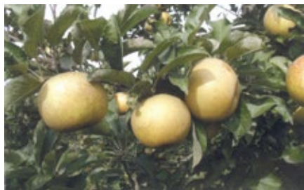
8. ábra. Parker pepin

Téli piros pogácsa (syn.: Piros pogácsa alma): Mi ősi magyar fajtának tekintjük. Kisüzemi és házi kerti termesztésben volt keresett. Nagy értéke, hogy az Alföld homokjain is jól tenyészik. Erős növekedésű, igénytelen fajta (9. ábra). Szép színű, jól tárolható fajta. Termesztésben tartása igénytelensége miatt indokolt. Szakszosan terem. Íze kissé fanyar, „timsós”. Gyengébb asztali fajta, viszont a piacon elsőrendű.