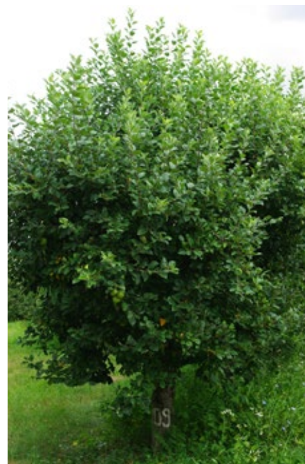
14. ábra. A Batul fajta termőfája