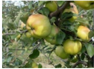
3. ábra. London pepin

Londoni pepin (syn.: Magyar kálvil, London pippin, Londonpepi): A XX. sz. közepén üzemi állománya Szabolcs-Szatmár-Bereg megyében 30,9 % (3. ábra). Domináns fajtaként ismerték. Igen kedvelt fajtánk volt. Szép termése sárga színű, finom hússzerkezetű. Kevésbé jól tárolható, bár a mai tárolástechnika, technológia melletti viselkedését nem ismerjük. Elsőrendű étkezési és kereskedelmi fajta. Hátránya az igényessége, a károsítókkal szembeni érzékenység. Hajlamos a magháztrohadásra. A szárazságot rosszul viseli.