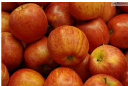
10. ábra. Cox narancs renet

Cox narancs renet: Üzemi és házi kerti fajta. Hajdan részaránya Szabolcs-Szatmár-Bereg megyében 17,9 % volt (10. ábra). Termése igazán kellemes ízű, zamatú. Nem minden évben szép a színe. Pirosan csíkozott. Érzékeny az edafikus és klimatikus tényezőkre. Gyümölcsre erősen perzselődhet. Károsítóknak kevésbé ellenálló. Nem tárolható jól. Fája speciális metszést igényel, gyorsan megöregszik. Elsőrendű étkezési és piaci fajta.