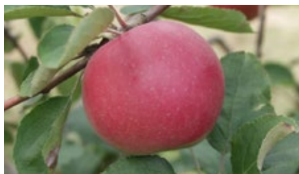
11. ábra. A Kenézi alma

Kenézi alma (syn.: Kenézi piros): fái igen nagyok, terebélyesek. Termése sárgás, egyik oldala pirosan csíkozott (11. ábra). Húsa kemény, jól tárolható. A história szerint szedése Kisasszony nap, azaz szeptember 8-a után kezdődött, s csaknem egy hónapig is elhúzódott. Nagy termésmennyiségét mi sem jellemzi jobban, hogy egy fáról közel egy szekérnyi almát szüreteltek. 1930-as években telepítették be a Szamos gátján belül, Szamoszeghez nem messzire fekvő Barát-rév kertjeit. Gulácson szívesen aszalták a kissé édeskés almafajtát.