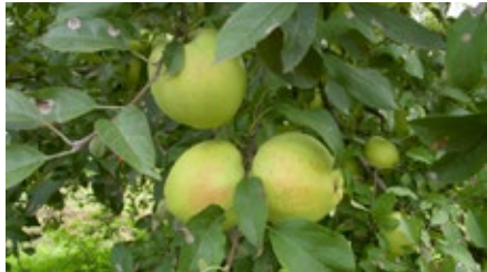
1. ábra. A Sárga szépvirágú

Termése nagy, darabos, éretten szép sárga színű. Késő őszi, kora téli fajta. Hússzerkezete finom, inkább enyhén puha. Tárolhatósága kívánni valót hagy maga után, bár a modern hűtőtárolókban tárolva, nem ismerjük viselkedését. Igényes fajta, károsítókkal szembeni ellenállása gyenge, ez a tulajdonsága nem teszi előnyössé termesztését.