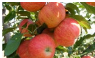
5. ábra. A Téli arany parmen

Téli arany parmen (syn.: Arany parmin) Batul (syn.: Zöld batúr, Sárga batúr): Hajdan elterjedt nagyüzemi fajta volt, házi kertbe is gyakran telepítették (5. ábra). Szabolcs - Szatmár - Bereg megyében 5,3 %-al volt jelen. Sok rossz és jó tulajdonsága van. Jó tulajdonságai még ma is indokolhatják házi kerti termesztését, így a korai termőre fordulás, jó tárolhatóság, nagy terméshozam, szép szín, kiváló aromás ízvilág, s jó pollenadó képesség. Hátránya a károsítókkal szembeni fogékonyság, vontatottan ér, nem bírja a szárazságot, de megkívánja a magas páratartalmat.