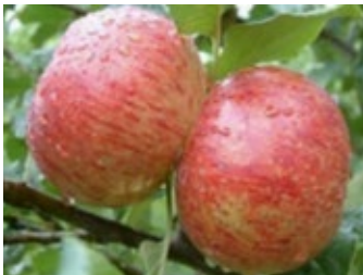
2. ábra. Asztraháni piros

Asztraháni piros (Asztragány alma, Asztragán): Termesztése házi kertekben volt jellemző. Előnye koraiságában mutatkozik, mint étkezési fajtának, bár gyakran vitték piacra is. Hamvas, szép piros színe, kellemes savas íze forró nyári időben keresetté tette e fajtát (2. ábra). A család napi gyümölcsfogyasztását elégítette ki. Ma is erre szolgál. Kiváló étkezési, piaci fajta. Hátránya az elhúzódó érés, az egyenetlen termésméret.