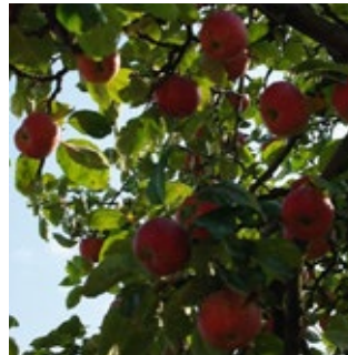
4. ábra. Nemes sóvári

Nemes Sóvári (syn.: Borka sóvári, Tiszaháti sóvári, Beregi sóvári, Piros sóvári): Régi magyar fajta, valószínűleg a Tisza felső folyásánál volt a Sóvári fajták termesztésének centruma, Szabolcs-Szatmár-Bereg megyében 20,2 %. Ma is itt találjuk a legnagyobb elterjedésben (4. ábra). Kiváló a fajta alkalmazkodó képessége. Későn ér, igen jól tárolható. Termésének színe egyedülállóan szép, hamvas, húsa hófehér. Jó étkezési, elsőrendű piaci fajta.