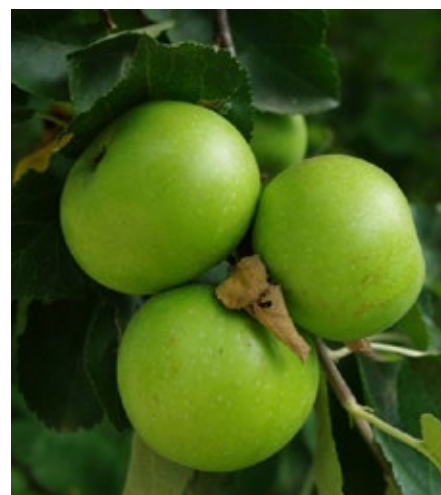
13. ábra. A Batul

Batul (syn.: Zöld batúr, Sárga batúr): Régi magyar fajta, feltehetően Erdélyből származik. Legnagyobb mennyiségben Szabolcs-Szatmár-Bereg megyében termesztették (34,7 %). Kellemes íze miatt elsőrendű asztali alma (13. ábra). A károsítókkal szemben igen ellenálló. Fája nagyon edzett, s nagy termőképességű (14. ábra). Egyes adatok szerint kifejlett termőfája 1 t termést is produkál. Hátrányos tulajdonsága, hogy termése beérve, könnyen le hull. Szárazságra nagyon érzékeny. Kíméletes kezelést kíván gyümölcsre, mert nyomásra érzékeny.