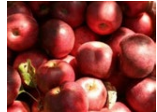
6. ábra. Jonathán

Jonathán: Közismert nagyüzemi és házi kerti fajta, hajdan „Szabolcs aranya” néven illették (6. ábra). Óriási szakirodalma van, s Szabolcs-Szatmár-Bereg megyében (43,7 % részarány) a gazdák nagy gyakorlatra tettek szert termesztésében. Ma is gyakran ültetik, főleg házi kertekben. A XX. sz. második felében a nagyüzemi termesztés fő fajtája volt. Mára érdemtelenül visszaszorult.