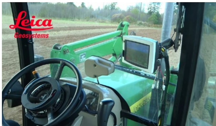
4. ábra. Leica SteerDirect ES John Deere traktoron

Ez utóbbi két kivitel esetében ki van zárva a megcsúszás lehetősége, ezért pontosabb az irányítás.