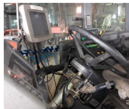
3. ábra. AutoTrac rendszer Lamborghini 135 Formulán (kormánytengelybe építve)