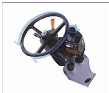
2. ábra. EZ-Steer kormányvezérlő dörzshajtással