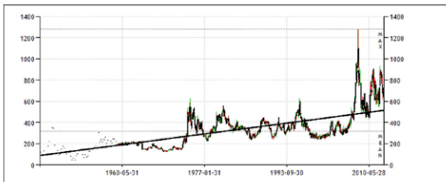
1. ábra: A búza árának alakulása az elmúlt 100 évben a Chicagai árutőzsde adatai alapján

A búza felhasználását tekintve élelmezési célra 70-80%-át használják, állati takarmányozásra 15-20%-át, a többi ipari felhasználásra kerül (vagy veszteségként számolják el - 5-9%).