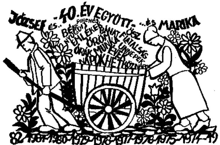
Szatyor Győző linómetszete, X3