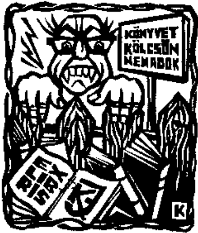
Karancsi Sándor linómetszete, X3

Öt éve, 81. születésnapja előtt néhány nappal váratlanul – bár tudtuk, hogy szíve elég sokszor rendetlenkedik – elhunyt a pécsi kisgrafikai élet egyik kiemelkedő szervező egyénisége, a sokoldalú gyűjtő, kiállítások és találkozók rendezője, a barát és a munkatárs. Halálával tulajdonképpen megszűnt a pécsi kisgrafikai élet, mely 1962-től mindig és mindenhol jelen volt a baranyai város és vonzáskörzete, illetve a hazai és nemzetközi porondon. Az a tevékenység, amit felvállalt, mindenütt elismerést váltott ki, ez azonban nemcsak személyének, hanem a magyar és ezen belül a baranyai ex librisnek és alkalmi grafikának is szólt. Kovács József halála után többek összefogásával egy emlékfüzet megjelentetése került szóba. Ez technikai okokból és némelyek slendriánságából nem készült el, csupán néhány hosszabb-rövidebb írás áll jelenleg rendelkezésünkre. Az elkészültekből az alábbi kettőt közreadva tisztelgünk Kovács József emléke előtt és emlékezünk mindarra, amit a maga módján és eszközeivel a hazai ex libris művészet baranyai és határainkon kívüli megismertetéséért tett.