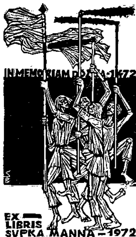
Stettner Béla linómetszete, X3

Az új, immár harmadik évezred első jelentős irodalmi ünnepét, a Madách-ünnepséget január 19-ikén rendezték meg Balassagyarmaton.