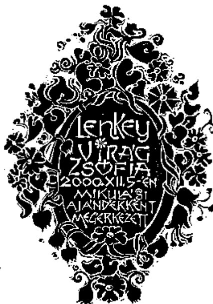
Szilágyi Imre linómetszete, X3