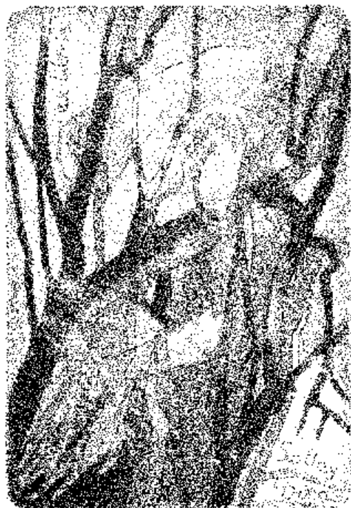
Xantus Géza, aquatinta, C5

A korábbi fázist is a kiállított 14 aquatinta nyomat képezi, melyek többsége az 1990-es évek második feléből származik. Tematikailag a sorozat több eleme a grafikának, mint illusztratív műfajnak a hagyományába illeszkedik, a választott témát - a Jelenések könyvét, a Dance Macabre tematikát - azonban a művész személyes keresztény hitén átszűrve, a jelenkor aktualitásához illeszkedve dolgozta fel. Az apokaliptikus víziók egyszerre szólnak az emberiség megsemmisülésének veszélyéről és a pusztulás után beálló új világrendről. A kompozíciók mindenütt zártak, a fekete háttér előtt világító testek, formák térben és időben is a végtelenben lebegnek, örvénylenek. Konkrét aktualitással bír a Balkáni keselyűk című kép, amely a balkáni háborúk borzalmait, az erőszakot, a világ felborult egyensúlyát allegorikus képekkel idézi fel. Másról a mindennapokból, személyes élményekből merített témák kapnak teret: a chagalli, álmon átszűrő motorizált környezet, az intim emberi kapcsolatokat a terhelő feszült csend.