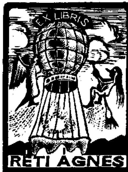
Réti András linómetszetei, X3

Lapjai szerteágazó, bonyolult történeteket, izgalmas cselekményeket és nem utolsósorban az álom és a képzelet világát, olykor a valóság feletti, szürrealista dimenziók világát jelenítik meg. Az így keletkezett "görbe tükör" valóságunkat mutatja, a messzibe vesző múlt és a még láthatatlan jövő között. Kifejezési eszközeinek egyik esztétikai minőségét a groteszk és a rút