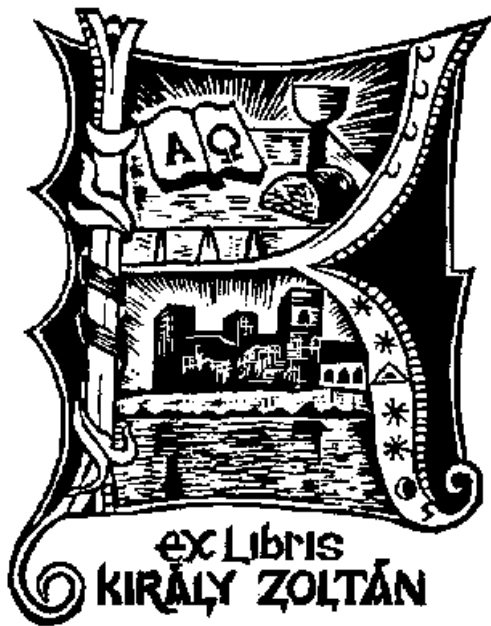
Sólyom Sándor linómetszete, X3

1890-ben testvére, Kossuth Lujza meglátogatta a Jogakadémiát, ahol a fogadáskor azt tapasztalhatta: "sehol úgy nem szeretik Kossuthot, mint Patakon". Az ifjúság 1892-ben emléktáblával jelöli meg a házat, amelyben joghallgatóként lakott, 1894-ben, a nagy temetésen pedig Patak jogáshallgatói küldöttséggel képviseltették magukat és hat hetes gyászt fogadtak. A város 1895-ben "a modern magyar állam megteremtőjének" emlékére Kossuth Alapítványt létesít, 1902-ben születésének