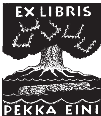
E. Tuominen rajza, P1

Exlibris Egyesület szilárd meggyőződése, hogy a könyv – és vele a könyvjegy – soha nem fog eltűnni a világunkból.