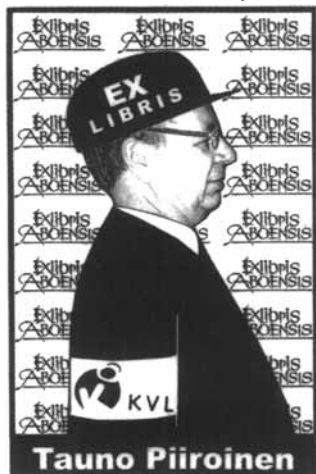
E. Tüür grafikája, P7

A könyvjegy nem veszített jelentőségéből, de az a veszély sem fenyeget, hogy az információ-robbanás jelenlegi korában a könyv feleslegessé válna. Az a tény, hogy Finnországban évente megszámlálhatatlan mennyiségben adnak ki könyveket, nem vezet e kiadványok értékének csökkenéséhez. A Finn