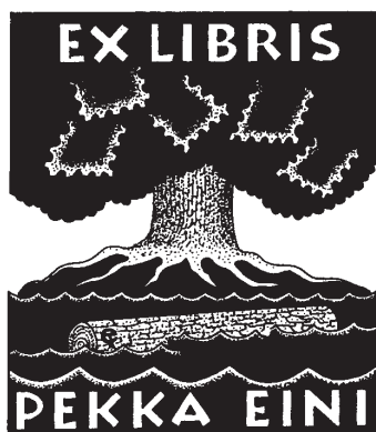
E. Tuominen rajza, P1

Exlibris Egyesület szilárd meggyőződése, hogy a könyv – és vele a könyvjegy – soha nem fog eltűnni a világunkból.