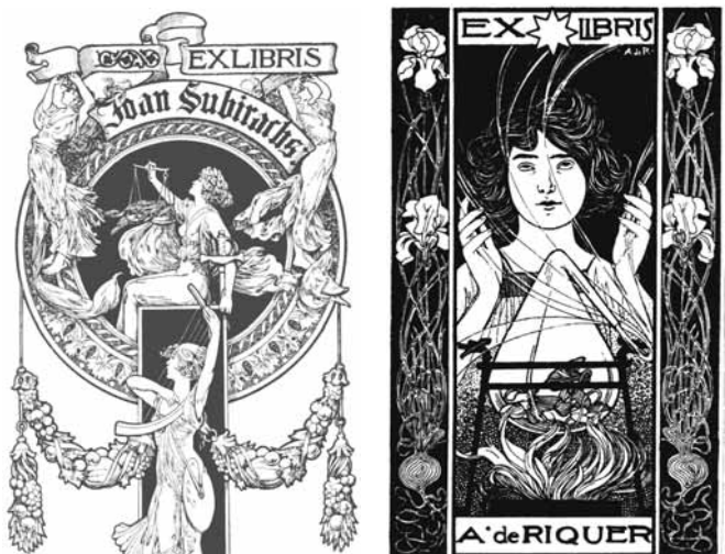
Alexandre de Riquer grafikái

A katalán egyesület EXLIBRIS c. lapjának 33. száma pompás külsővel, rendkívül gazdag tartalommal jelent meg. Teljes terjedelmét Alexandre de Riquer (1856-1920) festő, grafikus és