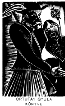
Budai György fametszete, X2+T