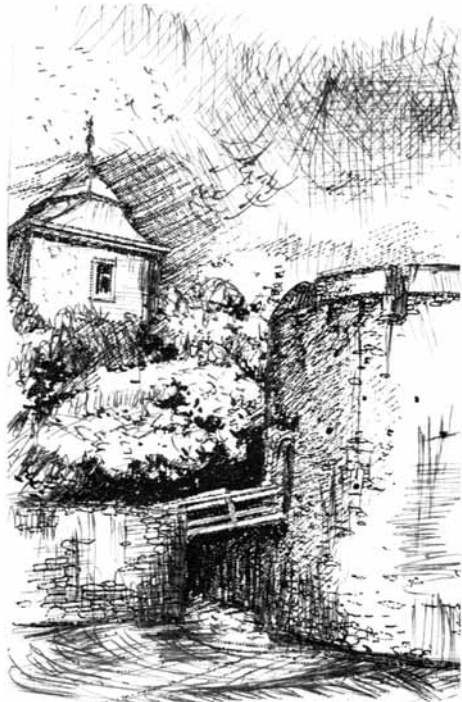
Pécs, Barbakán. Nőt Béla tollrajza, P1

Nőt Béla azonos méretű (15x10 cm-es), álló téglalap formátumú, egyazon barna színű tollrajzai igazi műalkotások. Olyan „minigrafikák” amelyek szebbek a legmodernebb technikával készített fotóknál. Felidéznek a város történeti, építészeti hagyományait, egy-egy városrész atmoszféráját. Azt is megmutatják: rajzoló Mesterük nagyon kötődik ehhez a városhoz, ismeri és szereti épületeinek minden zegzugát, fölnezi a házak tetejéig, észreveszi és képein életre kelti a házakat körülvevő fákat, bokrokat, a tornyok feletti felhőket. Kis méretben is igényesen