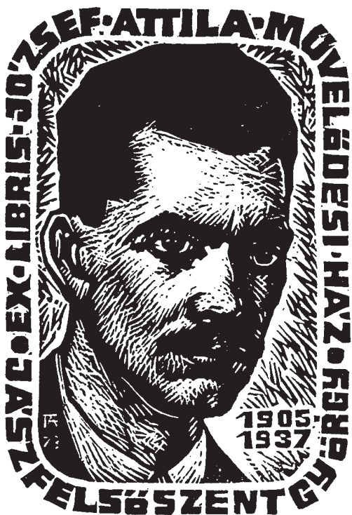
Fery Antal fametszete (1973), X2

A Fery Veronika által szerkesztett Fery Antal élete és munkássága, alkotásainak jegyzéke című kézikönyv ismertetésekor (Kisgrafika, 2006/2. sz.) írtam arról, hogy az ex librisek, alkalmi lapok tulajdonosaira utaló névmutatóban csak a személynevek szerepelnek, így a közgyűjtemények részére metszett lapok közül csak azok kereshetőek vissza, amelyek nevében személynév is előfordul. (Pl. Károlyi Mihály Országos Mezőgazdasági Könyvtár.) Mindenesetre az adattár ettől függetlenül kitűnő lehetőséget nyújt arra, hogy annak tételenkénti átnézésével azonosíthassuk a könyvtárak, múzeumok, iskolák s egyéb közgyűjtemények részére készített ex libriseket. Ezek száma (közéjük számítva a külföldi könyvtárak részére készültet is)