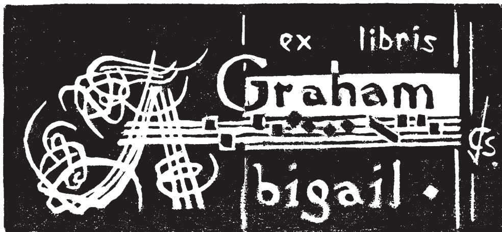
Vályi Csaba linómetszete (2006), X3/2

Az Antall József néhai miniszterelnökünk által egykor vezetett intézmény két tagas termének falain ízléses elrendezésben sorakoztak a neves anatómus színes