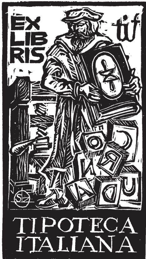
Szentessy László linómetszete (2006), X3