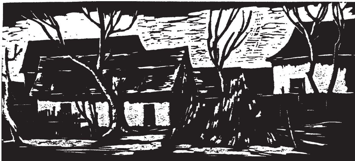
Király István: Falusi udvar, linómetszet, X3