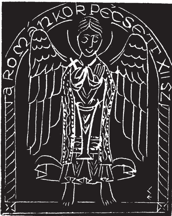
Soltra Elemér linómetszete, X3

tűrhet meg. Ezt azonban úgy kell kivitelezni, hogy ne maradjon nyoma a gépiességnek; könnyed, szellemes és örömet szerző hatású legyen. Így lehet valóban könyvjegy belőle, amely díszíti is a könyv első lapját.”