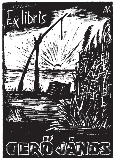
Andruskó Károly linómetszetei, X3

Kilencvenhárom éves korában, február 26-án elhunyt Andruskó Károly , a grafika, az ex libris, a miniatűr könyv világhírű művésze, az akvarell, az olajkép értő mestere. 1915-ben Zentán született, a kubikosvilágból indult. Már hat éves korában folyamatosan írt és rajzolt, de szegénysége miatt nem tanulhatott, így 1932-36 között nyomdász Zentán és Eszéken, 1943-ban a Szegedi Kereskedelmi és Iparkamarától kapott nyom-