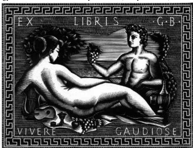
Italo Zetti grafikája, X2

Italo Zetti az olasz és az európai fametszés egyik legrepresentatívabb személyisége, nemzetközileg is magasan jegyzett alakja sok kapcsolatot ápol a korabeli magyar grafikai élettel; így levelezésben állt Semsey Andorral, Fery Antallal, Bordás