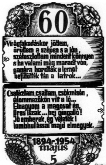
Nagy Árpád fametszete, X2, Op. 412 (288), 1954, 127×77

Az első világháború öt is elérte. 1916-ban bevonul és a