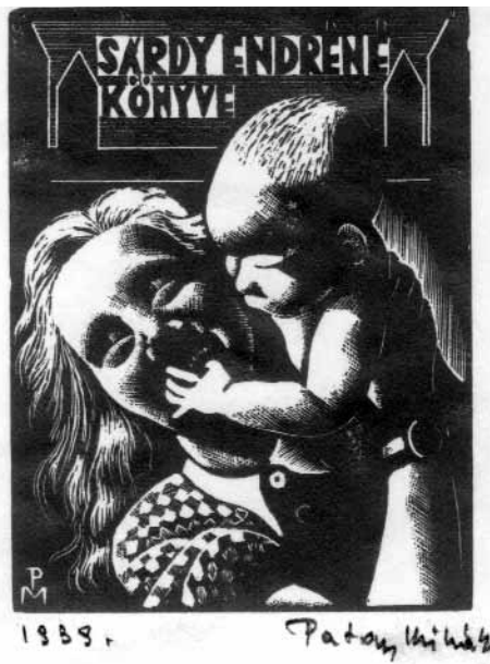
Patay Mihály fametszete, X2 (1939), 74×55

Bizony már itt is elég hidegek vannak. Éjjelenként eléri már a 7-8 fok hideget is és nappalónként is sokszor fagyponthoz alacsony az idő. Az emberek majd megfagynak, mert a lakások