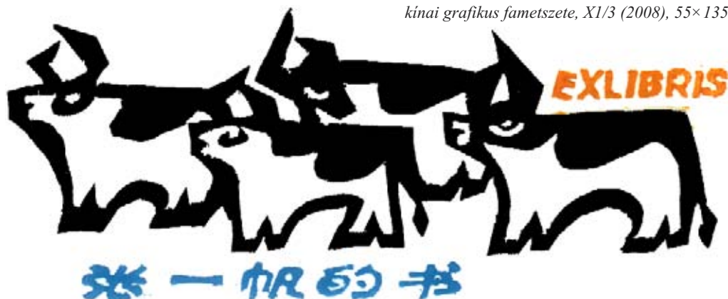
kínai grafikus fametszete, X1/3 (2008), 55×135