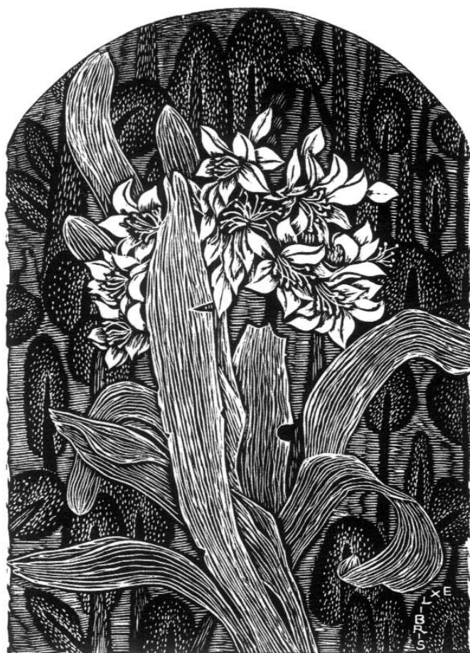
kínai grafikus munkája, 137×100

és talán 80 körül lehetett a külföldiek száma. Pontos számot még a búcsúvacsora során sem sikerült megtudni.