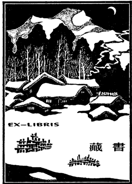
kínai grafikus munkája, 100×70

tatabányai alkotó személyében. Ugyancsak Magyarországról Dudits Mónika egy lappal.