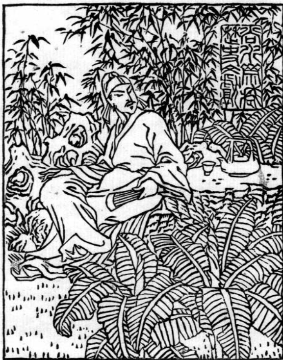
kínai grafikus fametszete, XI, 96×76

kaptak a résztvevők, erre kellett a fényképet is felragasztani a regisztráláskor, ami tovább növelte a bonyodalmakat, s a fényképnek ilyen módon nem is volt értelme. Hamar kiderült, célszerű a lapocska hátára is felírni a nevet és az országot, hiszen ötven százalék esélye volt, hogy éppen fordítva van. Túlnyomórészt természetesen kínaiak voltak a résztvevők (kb. 140 fő),