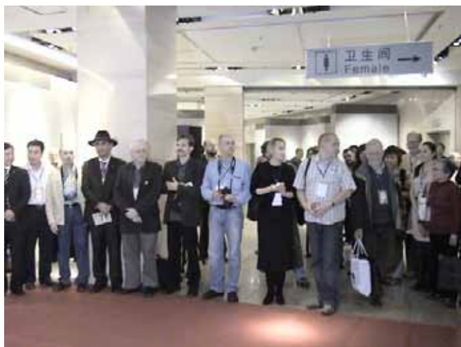
Az ünnepélyes megnyitó képei

Kína nagy lelkesedéssel látott neki a kongresszus megrendezéséhez. 2008. október 13. és 17. között zajlottak le az események Peking belső részében, a „Beijing World Art Museum” helyiségeiben, mely a China Millenium Monument épületében van.