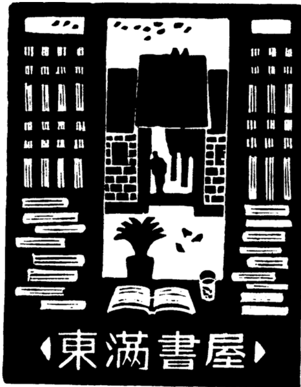
kínai grafikus munkája (1998), 77×100