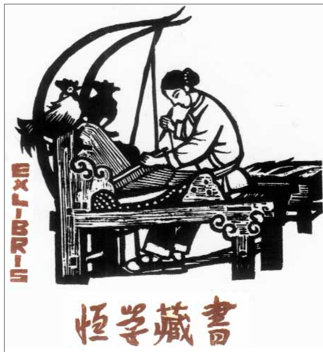
kínai grafikus munkája (2004), 120×110