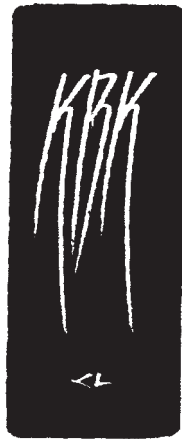
Kerékgyártó László, CAD (2008), 77×23