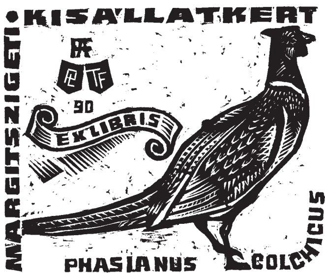
Fery Antal fametszete, X2 (1990), 70×85