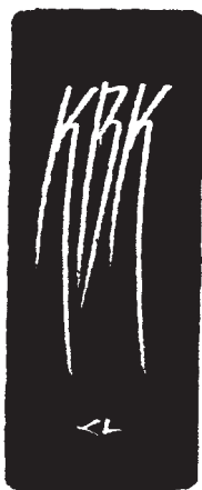
Kerékgyártó László, CAD (2008), 77×23