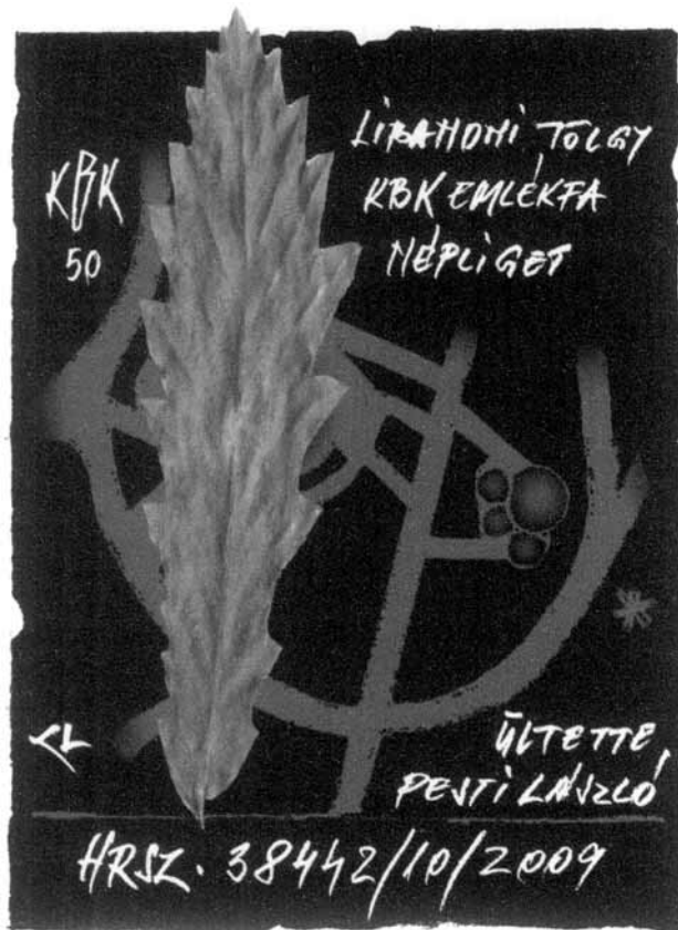
Kerékgyártó László, CAD (2008), 110x80

Pesti László tagtársunk, aki már többször bizonyította elkötelezettségét egyesületünk irányában, valamint számtalan sortozatot készített grafikusokkal növényekről, budapesti és országos nevezetességekről, újabb tanújelét adta, hogyan lehet különleges ötletekkel is népszerűsíteni a KBK-t. A budapesti Népligetben emlékfát ültetett egyesületünk 50 éves jubileu-