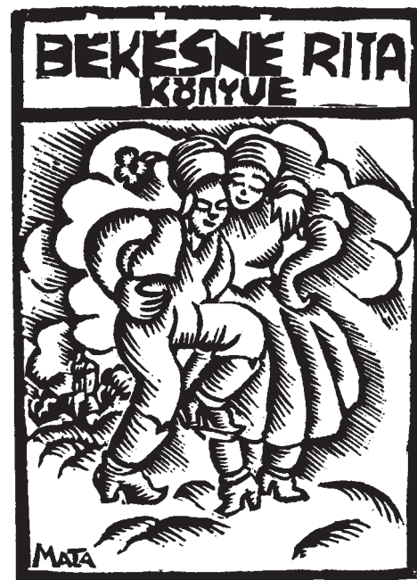
Szoboszlai Mata János fametszete, X2, 1935, 85×60