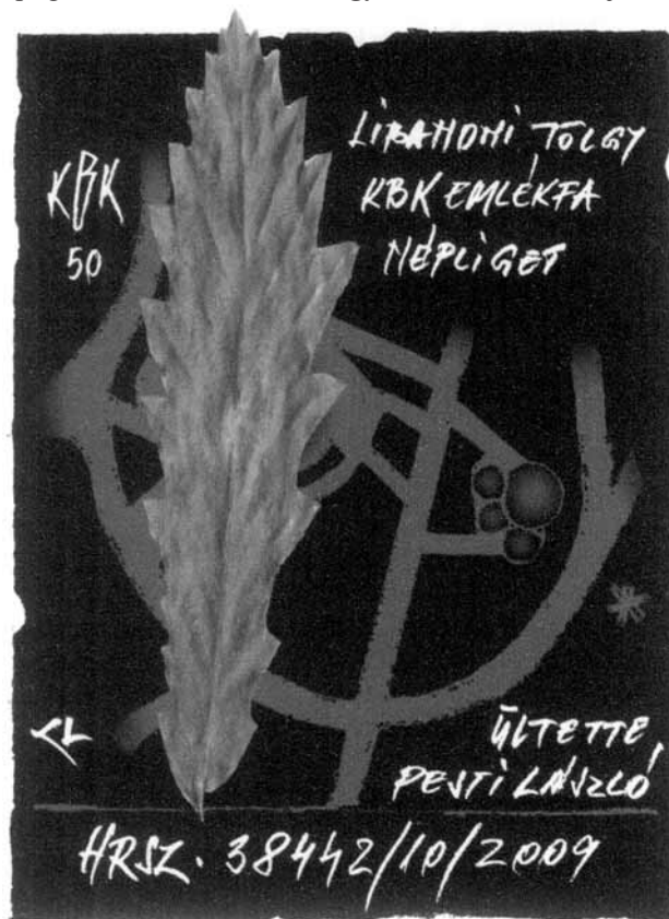
Kerékgyártó László, CAD (2008), 110x80

Pesti László tagtársunk, aki már többször bizonyította elkötelezettségét egyesületünk irányában, valamint számtalan sortozatot készítettett grafikusokkal növényekről, budapesti és országos nevezetességekről, újabb tanújelét adta, hogyan lehet különleges ötletekkel is népszerűsíteni a KBK-t. A budapesti Népligetben emlékfát ültetett egyesületünk 50 éves jubileu-