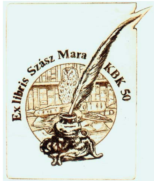
Olexa József rézkarca, C3 (2008), 80×66