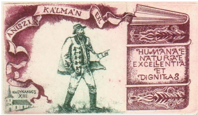
Bálint Ferenc rézkarca, C3, 56×100

szített in memoriam-lapok, a híres épületeket (pl. a pozsonyi várat) bemutató képek. Hosszú sort alkotnak a bibliai témák, láthatjuk Máriát a kisdeddal, a háromkirályokat, a Szent Család Egyiptomba menekülését, Jézust az Olajfák hegyén, majd töviskoronás fejjel. „Remény” című grafikáján töviskoszorúból levelet növelő ág hajt ki: csodaszép jelképe a megújuló életnek, akár a feltámadást hirdető keresztény tanításnak is.