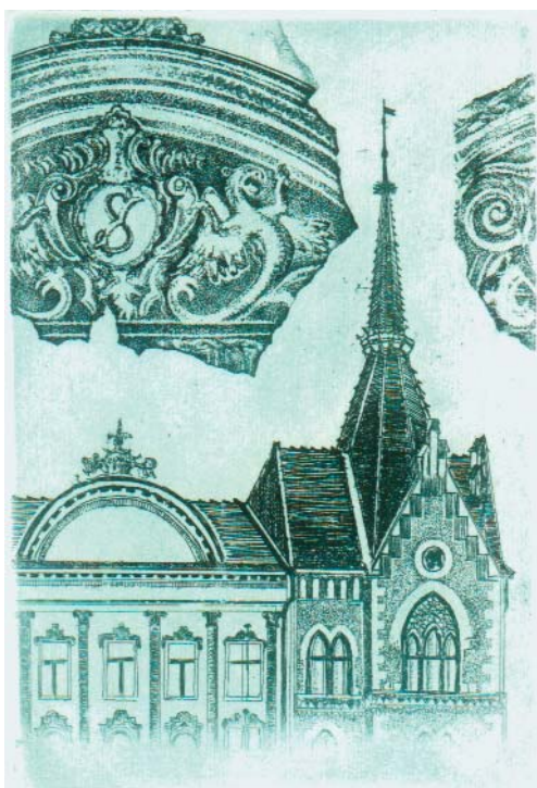
Bálint Ferenc rézkarca: Kolozsvár, Széki ház, C3, 96×64