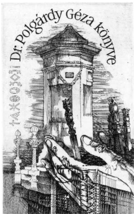
Deák Ferenc rézkarca, C3

ápolni. S sokszor ezek az apró műalkotások mondták el azokat a gondolatokat, melyek megfogalmazása, sőt megfogása is tiltott volt. A hatalom nyomasztó súlya alatt mégis kiváló művek születtek; mind az idősebb, mind az ifjabb nemzedékhez tartozó alkotók keze alól kitűnő rajzok, grafikák kerültek ki, az egész ex libris-világ csodálatát kivívva. Rózsa nemcsak hogy felismerte e grafikusok nagyszerűségét, hanem megrendeléseivel bátorította, segítette is őket. Számos grafikai lapot készített számára, egy művész olykor többet is. Ő kifejezetten csak a mélynyomású lapokat gyűjtötte, a rézkarcok mellett a mélynyomásos grafikai technikák változatos megoldásait, fekete-fehér és színes nyomtatásokat egyaránt.