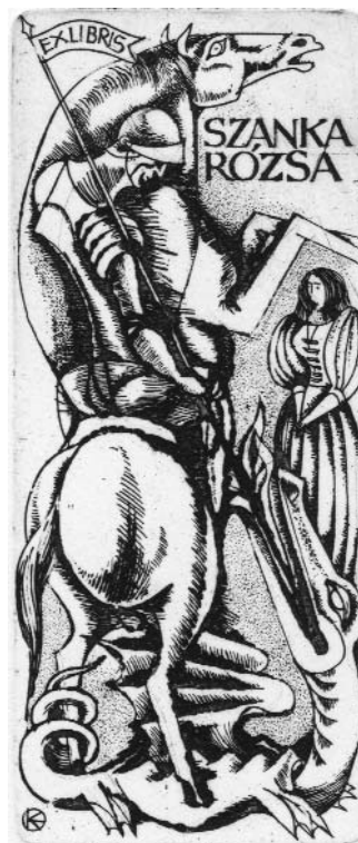
Kazinczy Gábor rézkarca, C3