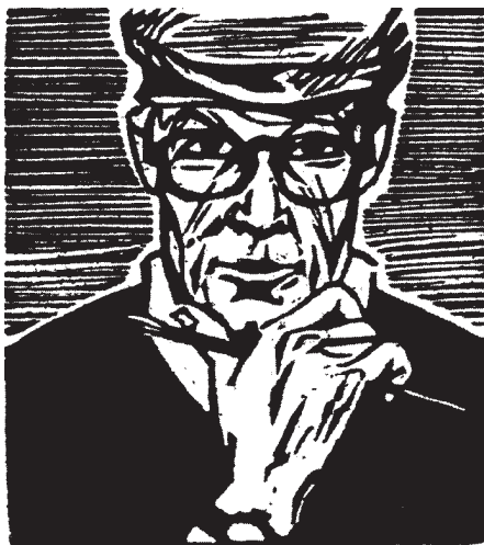
Ulrich Bewersdorf fametszete, X2

A MITTEILUNGEN DER DEG 2009/1. számában a szokott elegáns külsővel, 6 oldalon színes illusztrációkkal jelent meg. Egy cikkében Klaus Rödel emlékezik meg a 89 éves korában elhunyt Ulrich Bewersdorf (1920-2008) fametsző művészről, aki a hallei egyetemen a leendő művészek egész