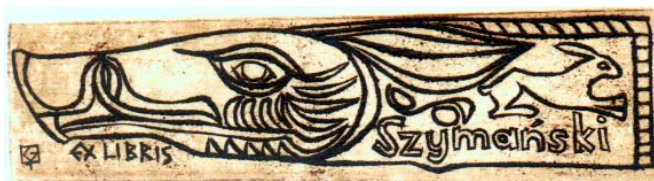
Kőhegyi Gyula műanyagmetszete, X6, Op. 67 (1970), 25×95

Hány éves korodban és miként derült ki, hogy a rajzolga-táshoz tehetséged van?