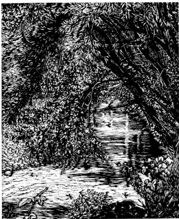
Gy. Szabó Béla fametszete, X2 (1952)