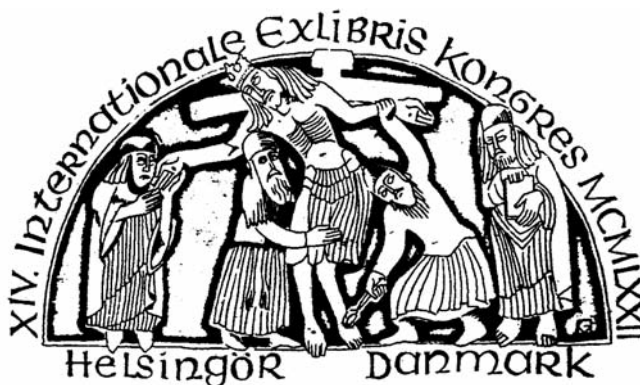
Köhegyi Gyula rézkarca, C3/C5, Op. 94 (1972)