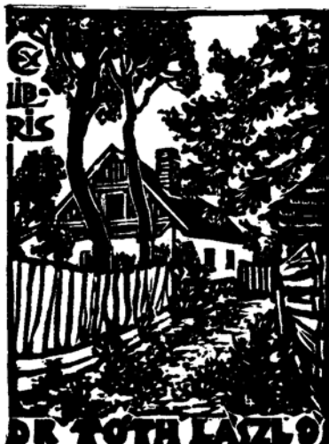
Imre Lajos fametszete, X2, 66×50

A falakon látható művektől körülveve, a központi asztalon közszemlére kitétték a mér-