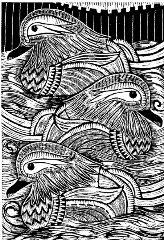
Tavaszy Noémi linómetszete, X3

2009. szeptember 10-én nyílt meg az Artotékában (Budapest, Szent László tér 7-14.) Tavaszy Noémi grafikus-festőművész „Bárdos Lajos emlékére” c. kiállítása. Az alkalom Bárdos Lajos születésének 110. évfordulója volt. A kiállítás október 6-ig volt látható.