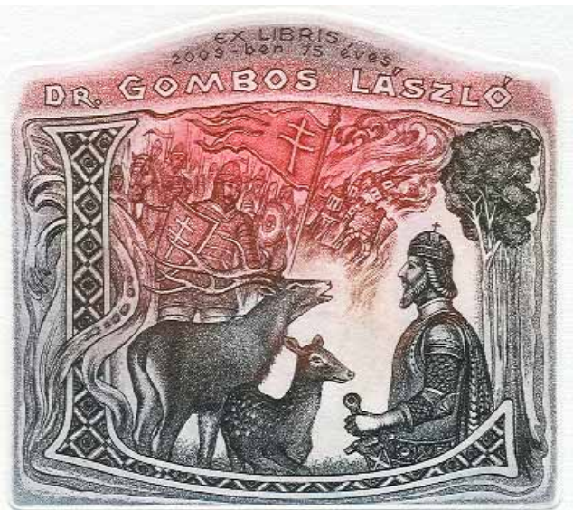
Bálint Ferenc rézkarca, C3/C5 (2009), 90×100

Sok emlékezetes kiállítást rendezett már a magyarországi Volksbank Zrt. a Szabadsághegyen, az Istenhegyi út 40/A szám alatti galériájában. Az intézmény tájékoztatójában törekvéseikről az alábbiakat olvastuk: „A cég folyamatos kihívást, megmérettetést szeretne biztosítani a hazai kortárs amatőr, ill. profi képzőművészeink számára.”