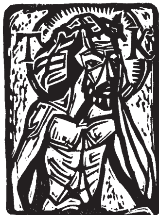
A. Buchanicec (PL) linómetszete, X3 (1975), 63×45

Exl. EX LIBRIS N. TÖRÖK (Kezében országalmát tartó angyal) X2, 95×66 mm