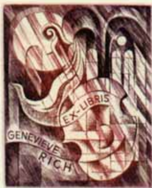
98 – RICH GENEVIÈVE C3, C5 1993 [95 x 80]