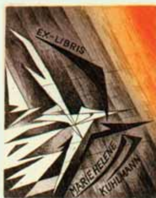
100 – KUHLMANN MARIE-HÉLÈNE C3, C5 1993 [96 x 80]