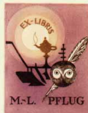
97 – PFLUG MARIE-LOUISE C3, C5 1993 [105 x 80] PROFESSEUR DE FRANÇAIS AU LYCÉE TECHNIQUE DE COLMAR.