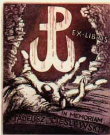
103 – CIESLEWSKI TADEUSZ IN MEMORIAM C3, C5 1994 [120 x 94] CONCOURS VARSOVIE 1994 (POLOGNE)