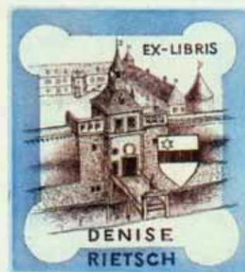
96 – RIETSCH DENISE C3, C5 1993 [100 x 90] PROFESSEUR DE MATHÉMATIQUES / VUE SUPPOSÉE DU CHÂTEAU DE HORBOURG (HAUT-RHIN)