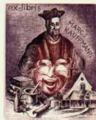
101 – KAUFFMANN MARC C3, C5 1994 [100 x 80] CONCOURS RABELAIS 1994 (A.F.C.E.L.) (REPRO. ELF N° 192 P.DE COUVERTURE)