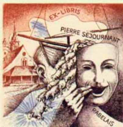
102 – SEJOURNANT PIERRE C3, C5/2 1994 [108 x 100] CONCOURS RABELAIS 1994 (A.F.C.E.L.) (REPRO. ELF N° 193 P.78)