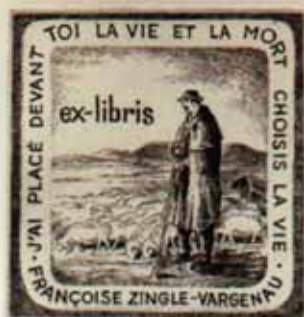
93 – ZINGLE-VARGENAU FRANÇOISE C3 1993 [80 x 80] PASTEUR