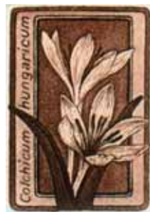
Bálint Ferenc rézmetszete, C3/C5, 40×28

Bálint Ferenc rézmetszete, C3/C5 (2009), 38×27