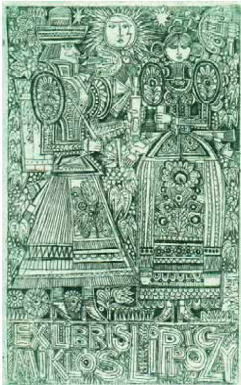
Kass János rézmetszete, C2 (1928), 105×65

„Ötven éves hűséggel, Kass János.” Ezzel az ajánlással küldte el nekem hatalmas, gyönyörű albumát. Én az új könyvre új könyvvel válaszoltam: „Több mint ötven éves hűséggel” – írtam új verseskönyvem belső címlapjára. Mert így igaz! Majdnem egy évszázadot éltünk le egymás mellett! Tudtuk, hogy csak a művészi teremtés emeli sorsunkat a származási, politikai, társadalmi és személyes élet gyötrelmes hétköznapi fölé, mint egy hosszú óriásdaru, a hernyótalpas gépi golya a roppant súlyú építkezési anyagokat, híd-elemeket, vasrúd-kötegek kévéit, épület-tetőszerkezetek vascsipke tornyait. Majd egy századot éltünk. És micsoda századot! Amelyben úgy szorzódtok egymásba és egymás mellé a jó és a rossz, a szorongás és a szerelem, a léthez-ragaszkodás és a félelem, a hűség és a halál, mint a csomózott keleti – perzsa, indiai vagy kasmír – szőnyegek mintázata, tavasz-virágzása és halálhit rejtelve, maradandóság-vágya, öröklét-tisztelete. Kass János elmúlt századunk egyik képzőművész zsenije volt. Rajzai, grafikái, karcjai Leonardo da Vinci, Dürer, Szalay Lajos és Pablo Picasso rajzaival mérkőznek szépségben és szigorúságban, azzal a Picasóéval, akinek több száz rajzát láttam Madridban, a Pradóban. Robusztus Biblia-mítosz alakjai, oroszlánarcú fekete merengései imádkozó sáskaszerű vonal-szerkezetek, vonal-szövetségei, vonalcsúcs hatyútornyai az elvirágzó időt és a mereven is hőmpolygó történelmet égették tudatunkra, mint amikor a legyalult