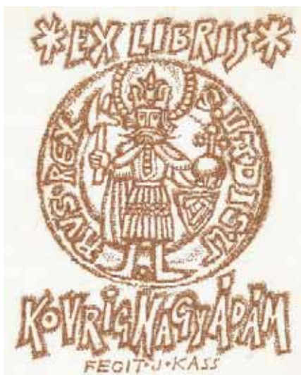
Kass János rézkarca, C3