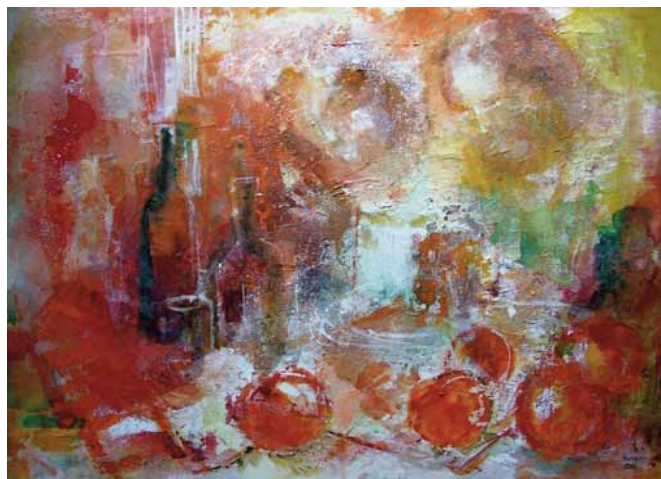
Bakacsi Lajos: Vacsora, akril (2010), 50x70 cm

1972-ben kapott diplomát. Önállóan, a megkezdett úton egyedüli segítői és tanácsadói a művészeti albumok és a tanulmányutak mellett a mestereitől kapott tanácsok voltak. Mintegy négy évtizedes munkásság áll mögötte. Bemutatkozása a Horváth Mihály utcai képtárban külső segítség nélküli volt. Sokfelé állított ki: Sándorfalván, a textilművekben, a Tarján-városrész-