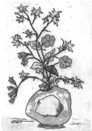
Moskál Tibor: Vázás ikebana, rézkarc, C3 (1994)