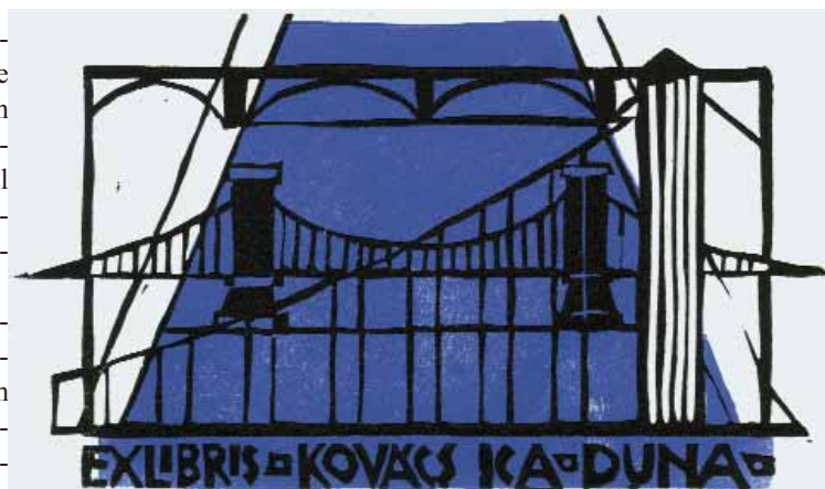
Salamon Árpád linómetszete, X3/2, Op. 62, 95×160